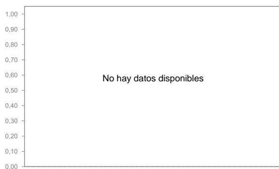
Evolución del valor liquidativo últimos 5 años